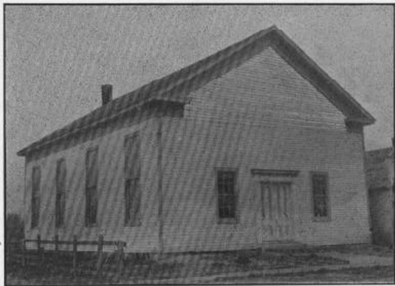
AIL GAPEL. ADEILADWYD YN 1866. COSTIODD $3,900.